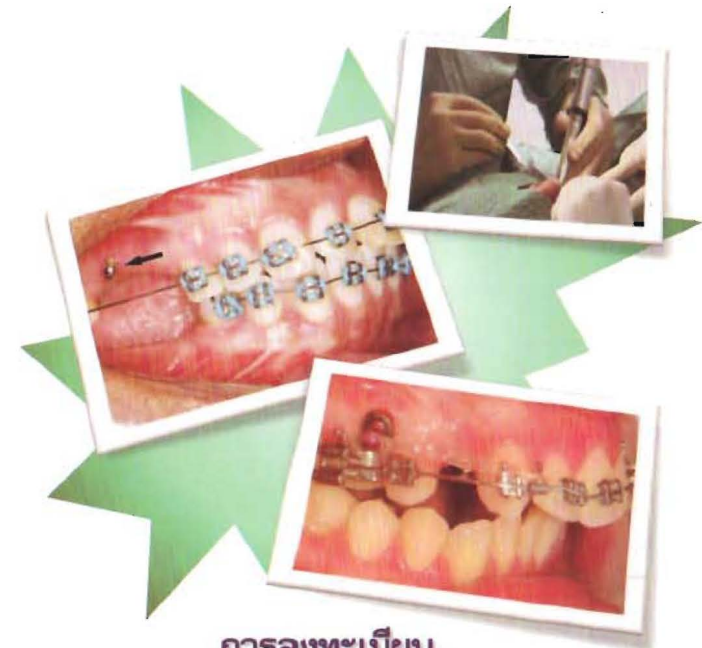
การลงทะเบียน